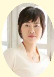
詩人・社会学者 水無田気流氏