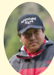
映画監督・脚本家 錦織良成氏