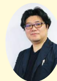
社会学者・社会哲学者 田中 人氏