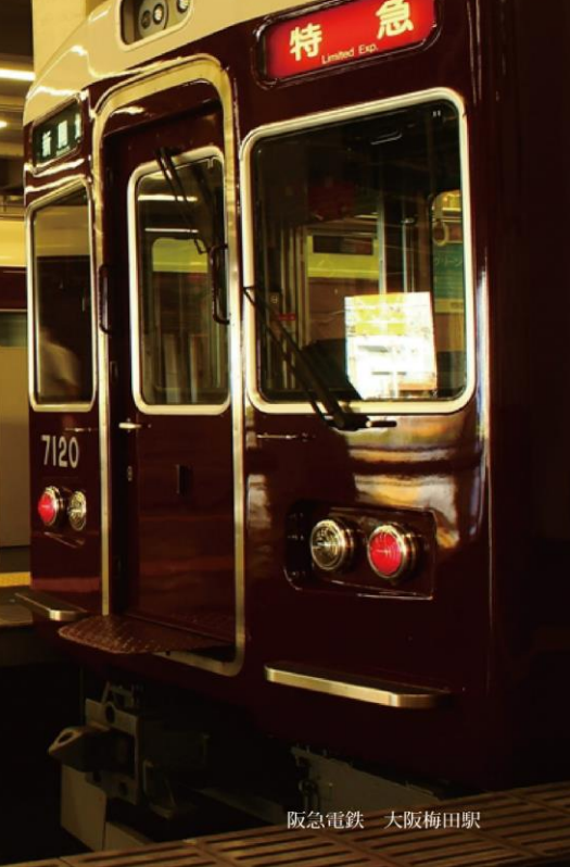
阪急電鉄 大阪梅田駅

「心の色」 須永真弘（埼玉県） 大阪に佇む始終点の駅 都会に響く乾いた雑踏が 数多の路線網のように絡み合う 出発を待つマルーンの列車は 乗客の心情により色味を変えていく 心に寂しさを覚えれば 暗く滲んで見えるだろう 心の舞い上がることがあれば 燦然と輝いて見えるだろう 「安全よし」扉が閉まる 列車は定刻に駆舎を後にした 流れゆく車窓と対峙する 大都会のキャンパスはひたすらに忙しい 淀川を渡った先、ふと天を仰いでみる あなたには何色の空が見えるだろうか