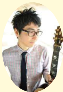
シンガーソングライター オオゼキタク氏