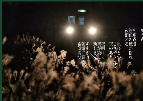
大井川鐵道 福用・大和田間