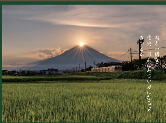
JR御殿場線 御殿場・足柄間